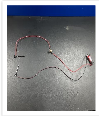
Gambar 1. alat peraga sederhana